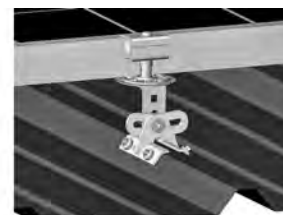
Montage von PV-Modulen, ohne Schienen, mit dem S-5! PV-Kit 2.0

Der Nachweis der Ein- und Weiterleitung der Lasten in das Trapezprofil sowie der Nachweis der Anbauteile und deren Verbindung muss separat geführt werden. Die Verantwortung für die Eignung, Montage und die Anwendungen wird vom Hersteller und RoofTech GmbH grundsätzlich nicht übernommen. Es sind die Montagehinweise und die Angaben und Bestimmungen gemäß der bauaufsichtlichen Zulassung Z-14.4.706 zu beachten (ggf. bitte anfordern).