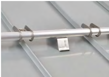
Optisch ansprechender Schneefang mit dem RoofTech Einrohrhalter Typ B (+ Eisstopper).

Schneefang mit dem RoofTech Einrohrhalter Typ B aus 2,5mm Edelstahl, montiert auf den S-5!® Mini-Klemmen, ist die klassische Variante mit einem handelsüblichen 32/2mm Rundrohr, der sich durch seine ansprechende Optik von anderen am Markt üblichen Schneefängen unterscheidet. Durch die hohe Lastenaufnahme des Halters in Kombination mit den S-5!® Mini-Klemmen werden ggf. auch weniger Schneefangreihen als bei anderen Schneefangsystemen benötigt. Die Montage ist einfach und das Rohr liegt dabei optimal direkt auf dem Falz.