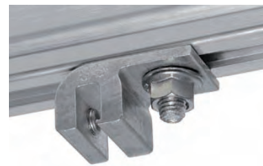
Schiene mit unterseitigem Schraubkanal befestigt auf S-5!® E-Mini-FL

Bei C-förmigen Schienen oder bei Schienen mit seitlichem Schraubkanal die mit Montagewinkeln seitlich befestigt werden, bieten die S-5!® Mini-Klemmen mit der oberseitigen M8-Gewindebohrung und zusätzlich mit einer M8-Edelstahlschraube eine flexible und stabile Befestigungsmöglichkeit.