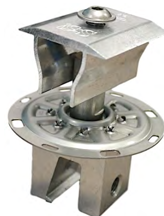
S-5!® PV-Kit 2.0 MidGrab montiert auf S-5!® Mini-Klemme