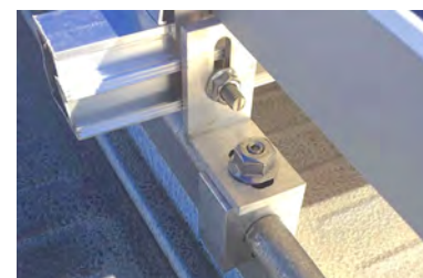
S-5!® Z-Mini montiert mit Winkeladapter an seitlichem Schraubkanal