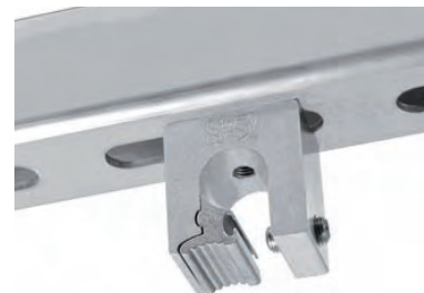
S-5!® Z-Mini für Rundfalzdächer montiert unter einer C-Schiene