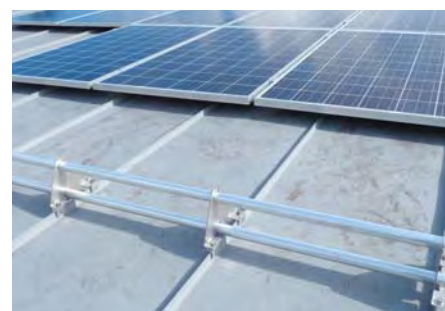
Doppelrohrhalter montiert mit zwei S-5!® E-Mini auf Doppelstehfalz für extra hohen Schneefang, z.B. vor Solaranlagen.