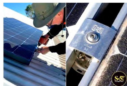
Dachparallele Montage quer zum Falz mit dem PV-Kit 2.0 MidGrab und E-Mini auf Doppelstehfalzdach: universell als End- und Mittel-Klemme einsetzbar.