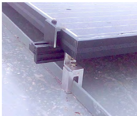
Schienensysteme mit S-5!® E-Mini-FL auf Doppelstehfalz und mit S-5!® N1.5-Mini auf Nailstrip-Falzdach.